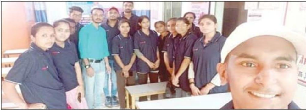
नव स्वदेश ■ सतना

इंदिरा गांधी कंप्यूटर कॉलेज, सतना में बॉश के ब्रिज प्रोग्राम के छात्रों के साथ विश्व युवा कौशल दिवस मनाया गया। इस दौरान प्रोफेसर इंदिरा गांधी कॉलेज सतना ने बतौर मुख्य अतिथि शिरकत की और एआई और कौशल विकास पर