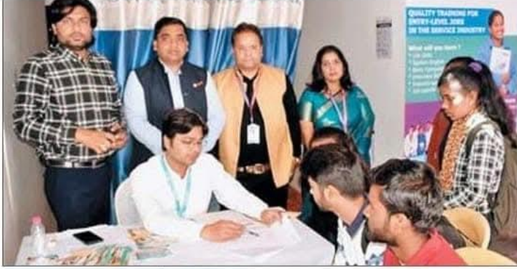
सतना, (नव स्वदेश)।

गुरुवार को इंदिरा गाँधी कंप्यूटर कॉलेज सेमरिया चौक संग्राम कालोनी में बॉश लिमिटेड के संयुक्त तत्वधान में मेगा जॉब फेयर का आयोजन किया गया। जिसमें देश की विभिन्न बैंकिंग एवं फाइनेंस सेक्टर से एचडीबी